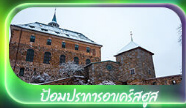
ป้อมปราการอาร์คส์ฮุส

เดินทาง 13-21 พ.ย. 69 / 04-12 ธ.ค. 69 25 ธ.ค. 69 - 02 ม.ค. 70 (ปีใหม่)