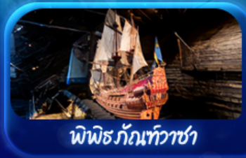
พิพิธภัณฑ์ทัวชา

Scandinavian Lover Capital Sweden Norway Denmark