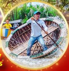
สุดพิเศษชมโชว์ Charming Show แสง สี เสียง สุดอลังการ