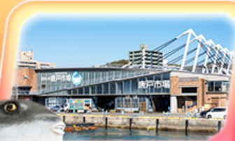
ตลาดปลาอาราโตะ