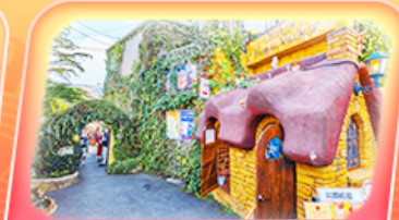
หมู่บ้านยูฟุอิน

สัมผัสกลิ่นอายญี่ปุ่นแท้ที่ศาลเจ้าดาโชฟู ของพรวัดนินโซอิน