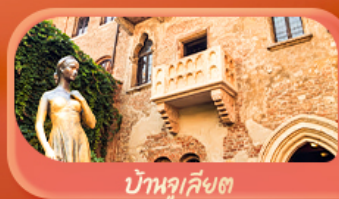
บ้านจูเลียต

Highlight เยือนหมู่บ้านแสนสวยเซอร์แมท เช็กอินศาลาไทยสุดงามที่โลซาน เที่ยวลูเซิร์น ชมสะพานไม้ชาเปลและอนุสาวรีย์สิงโต ซาลิ แชลลิน ชมประติมากรรม The Fork และปราสาทซิลลองริมทะเลสาบ เยือนมิลาน มหาวิหารดูโอโม ที่เวนิส เมืองลอยน้ำสุดโรแมนติก อินกับรักอมตะที่บ้านจูเลียต และช้อปปิ้งจุใจที่ Serravalle Outlet