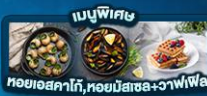
เมนูพิเศษ หอยแอสคาโก้, หอยมัสเซล+วaffle

พิเศษ ล่องเรือแม่น้ำเซน ชมเมือง โดย บาโต มูช