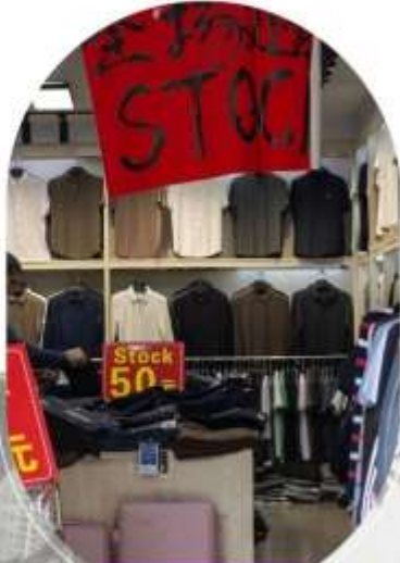
ตลาดค้าส่งอู่