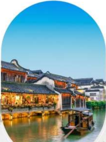
เมืองโบราณอู่เงิน