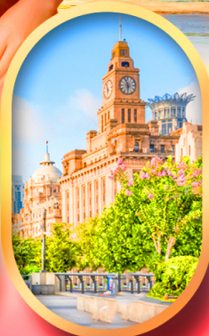
หาดไวกาน