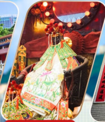
KWAN YUM HH