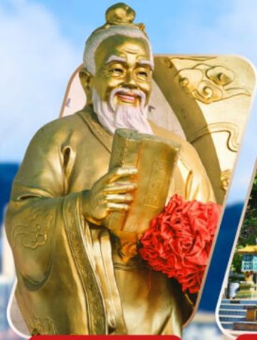
WONG TAI SIN