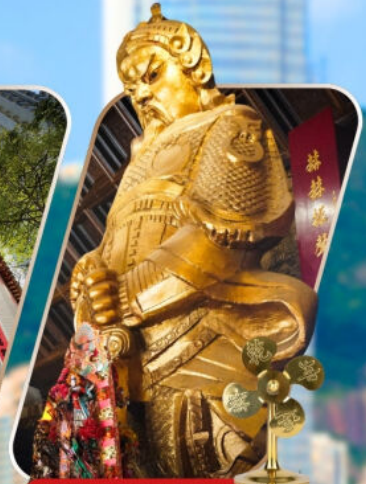
CHE KUNG (SHA TIN)