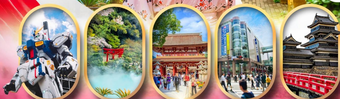
ห้างลาลาพอกันคัม อุมิจิกุคิ ศาลเจ้าดาไซฟุ ซ้อปปิงย่านเท็นจิน ปราสาทคามาโมโตะ