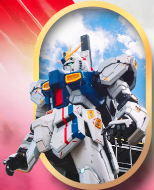
ห้างลาลาพอกันดั้ม