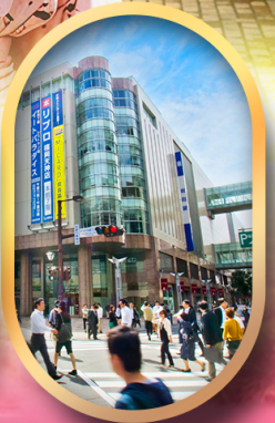
ช้อปปิ้งย่านเท็นจิน