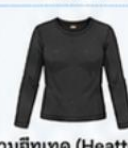
สวมฮีตเทค (Heattech) แบบหนาพิเศษด้านใน