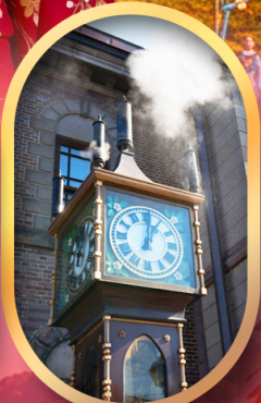
พิพิธภัณฑ์ถ้ำถ้ำคนตรี