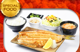
เมนูพิเศษ Set ปลาซอกเกะ