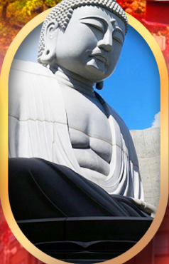
พระใหญ่อะตะมะ