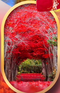
สวนฮิราโอกะ