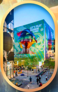
ย่านซานหลี่ถุน