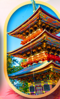
วัดนาริตะชิน