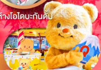
Fuji q Highland x Butterbear เดินทาง พ.ค. 69 เป็นต้นไป