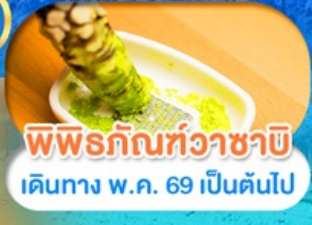
พีพีรภัทท์วาชาบิ เดินทาง พ.ค. 69 เป็นต้นไป