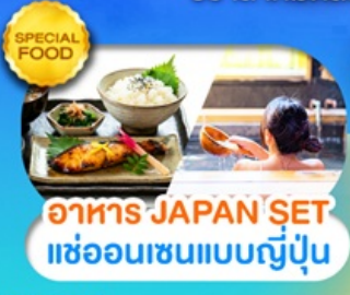
อาหาร JAPAN SET แะฮ้อนเซนแบบญี่ปุ่น