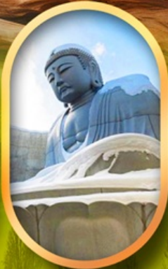
เนินเขาแห่งพระพุทธรเจ้า