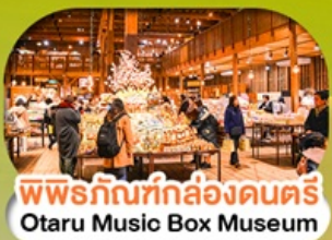
พิพิธภัณฑ์กล่องดนตรี Otaru Music Box Museum