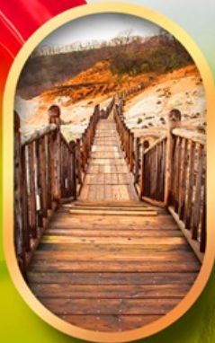
หุบเขาจิกุกดาบิ