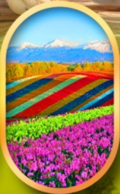
สวนดอกไม้ชิชิโซ