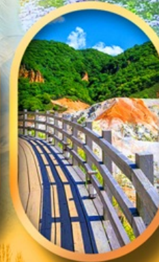
โนโบริเบ็ทสึ