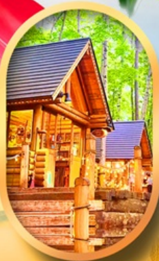
นิงเกิ้ลเกอเรส