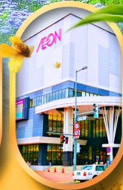
อีออนมอลล์