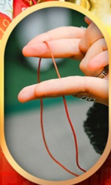
เสริมดวงความรัก