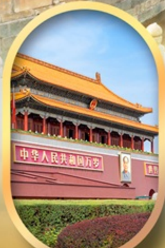
จัสมตริสเทียนอันเหมิน