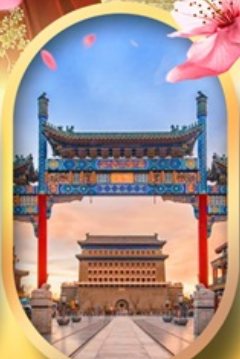
ถนนคนเดินเทียนเหมิน