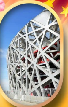
ผ่านชมสนามกีฬาฟาริงก