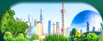
จุดเช็คอินสุดฮิต North Bund Shanghai

เซี่ยงไฮ้ หางโจว ล่องทะเลสาบซีหู ฟรีเดย์