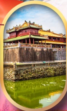
พระราชวังโคโน้ย