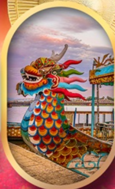
ล่องเรือมังกรแม่น้ำหอม