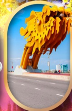
สะพานมังกรดานัง