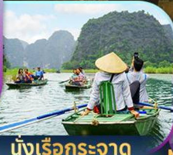
นั่งเรือกระจาด