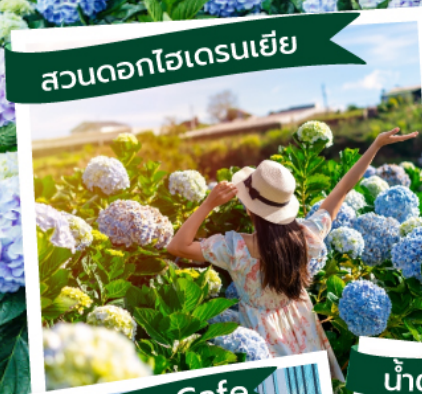
สวนดอกไฮเดรนเยีย