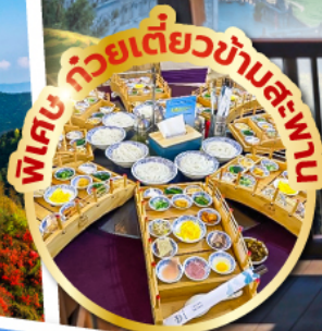
พิเศษ ภัตตาคารชาวม้ง