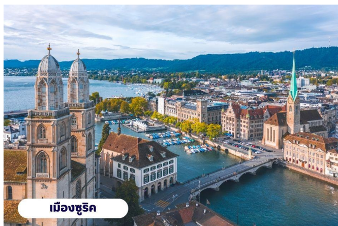
เมืองซูริค

เมืองซูริค ปัจจุบันจัตุรัสนี้ได้กลายเป็นชุมทางรถรางที่สำคัญของเมืองและยังเป็นศูนย์กลางการค้าของย่านธุรกิจ ธนาคาร สถาบันการเงินที่ใหญ่ที่สุดในประเทศ สวิตเซอร์แลนด์ นำท่านแวะถ่ายรูปกับ โบสถ์ฟรอมุนสเตอร์ (Fraumunster Abbey) จากบนสะพานมุนสเตอร์บรูค เป็นโบสถ์ที่มีชื่อเสียงของเมืองซูริค สร้างขึ้นในปี ค.ศ. 853 โดยกษัตริย์เยอรมันหลุยส์ ใช้เป็นสำนักแม่ชีที่มีกลุ่มหญิงสาวชนชั้นสูงจากทางตอนใต้ของเยอรมันอาศัยอยู่ นำท่านสู่ ถนนบาห์นโฮฟชตราสเซอร์