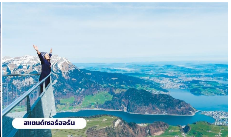
สแตนดเซอร์ฮอร์น