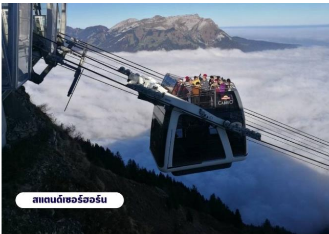
สแตนดเซอร์ฮอร์น

📍 บริการอาหารเช้า ณ ห้องอาหารของโรงแรม จากนั้นนำท่านเดินทางสู่สถานีกระเช้า เพื่อเตรียมตัวเดินทางขึ้นสู่ ยอดเขาสแตนเซอร์ฮอร์น (Mt.Stanserhorn) มีความสูงที่ 1,898 เมตร(6,227 ฟุต) ระหว่างทางคุณจะได้ชมวิวแบบพาโนรามาและให้ท่านได้สัมผัสการเดินทางโดยขึ้นกระเช้า “Cabrio” กระเช้าลอยฟ้าเปิดประทุนที่มี 2 ชั้นแห่งแรกของโลก และสามารถจุผู้โดยสารได้เกือบ 60 ท่าน โดยขึ้นดาดฟ้าจะสามารถจุได้ 30 ท่าน ระยะเกือบ 2 กิโลเมตร ระหว่างทางขึ้นสู่ยอดเขาท่านจะสามารถมองเห็นวิวแบบ 360 องศา จากนั้นให้ท่านได้เพลิดเพลินกับความสวยงามของธรรมชาติและทัศนียภาพที่งดงาม