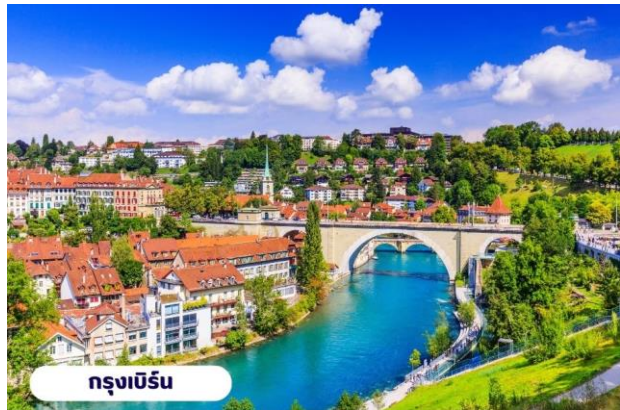
กรุงเบิร์น

📍 บริการอาหารเช้า ณ ห้องอาหารของโรงแรม จากนั้นนำท่านเที่ยวชมสถานที่สำคัญต่างๆในกรุงเบิร์น กรุงเบิร์นได้รับการยกย่องจากองค์การยูเนสโกให้เป็นเมืองมรดกโลก ในปี ค.ศ. 1863 นอกจากนี้เบิร์น ยังถูกจัดอันดับอยู่ใน 1 ใน 10 ของเมืองที่มีคุณภาพชีวิตที่ดีที่สุดในโลกในปี ค.ศ. 2010 นำท่านชม บ่อหมีสีน้ำตาล สัตว์ที่เป็นสัญลักษณ์ของกรุงเบิร์น นำท่านชม มาร์กาสเซ ย่านเมืองเก่า ปัจจุบันเต็มไปด้วยร้านดอกไม้และบูติก เป็นย่านที่ปลอดภัย จึงเหมาะกับการเดินเที่ยวชมอาคารเก่า อายุ 200-300 ปี นำท่านลัดเลาะชม ถนนจุงเคอร์นกาสเซ ถนนที่มีระดับสูงสุดของเมืองนี้ ซึ่งเต็มไปด้วยร้านภาพวาดและร้านขายของเก่าในอาคารโบราณ ชม นาฬิกาใช้ทศลือคเค่นทรม อายุ 800 ปี ที่มีโชว์ให้ดูทุกๆชั่วโมงในการตีบอกเวลาแต่ละครั้ง หอนาฬิกานี้ ในช่วงปี ค.ศ. 1191-1256 ใช้เป็นประตูเมืองแห่งแรก ภายหลังได้ดัดแปลงใช้ทศลือคเค่นทรมให้กลายมาเป็นหอนาฬิกา พร้อมติดตั้งนาฬิกาดาราศาสตร์เข้าไป จากนั้นอิสระให้ท่านเดินเล่นและเก็บภาพตามอัธยาศัยหรือจะเลือกช้อปปิ้งซื้อสินค้าแบรนด์เนมและซื้อของที่ระลึก