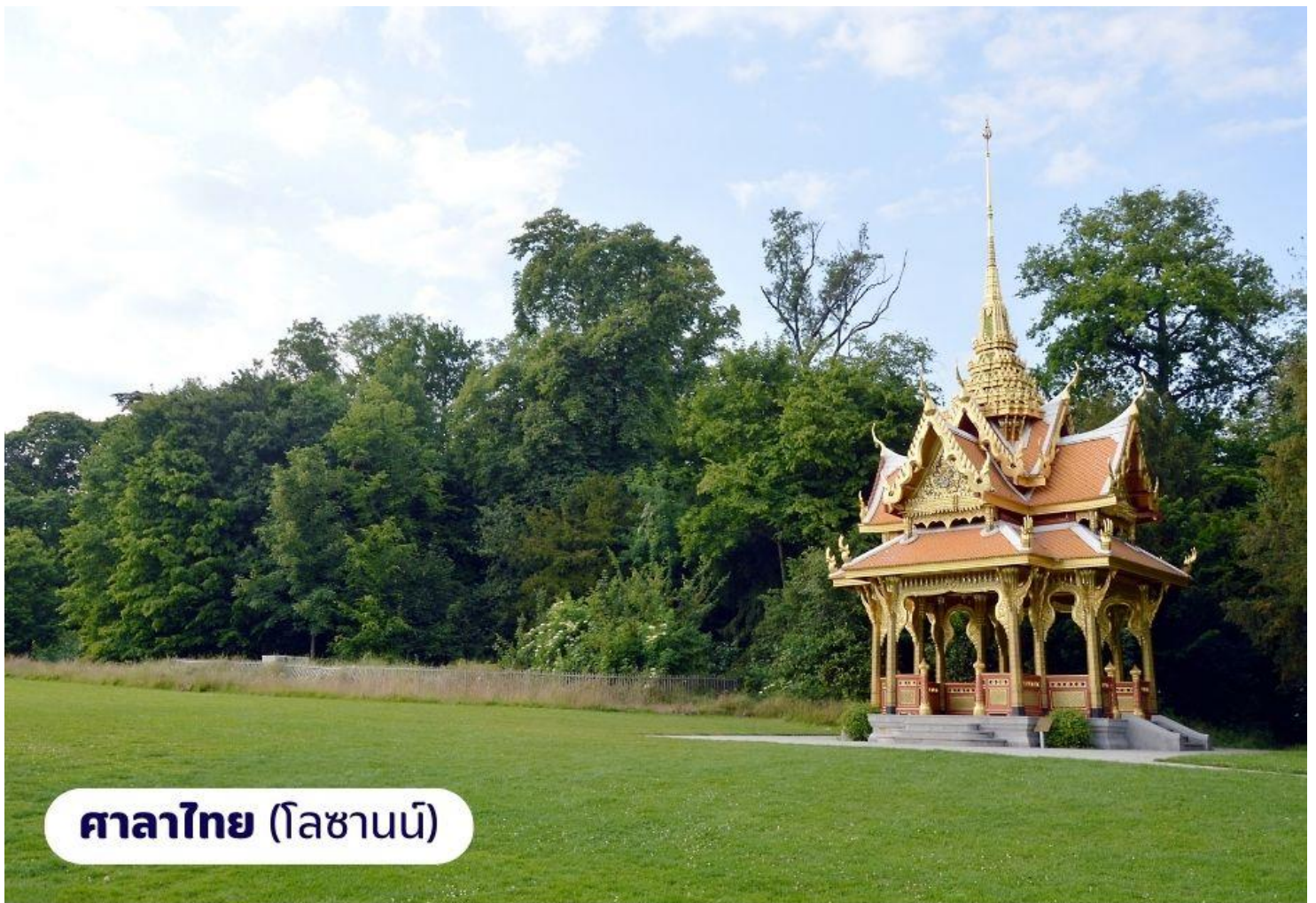
ศาลาไทย (โลซานน์)

จากนั้นนำท่านเดินทางไปยัง เมืองโลซานน์ เป็นอีกเมืองที่ตั้งอยู่บนของทะเลสาบเจนีวา เมืองโลซานน์นับได้ว่าเป็นเมืองที่มีเสน่ห์โดยธรรมชาติมากที่สุดเมืองหนึ่งของ สวิตเซอร์แลนด์มีประวัติศาสตร์อันยาวนานมาตั้งแต่ศตวรรษที่ 4 ในสมัยที่ชาวโรมันมาตั้งหลักแหล่งอยู่บริเวณริมฝั่งทะเลสาบที่นี่ เนื่องจากเมืองโลซานน์ตั้งอยู่บนเนินเขาริมฝั่งทะเลสาบเลคเลมังค์ จึงมีความสวยงามโดยธรรมชาติ ทิวทัศน์ที่สวยงามและอากาศที่ปราศจากมลพิษ จึงดึงดูดนักท่องเที่ยวจากทั่วโลกให้มาพักผ่อนตากอากาศที่นี่ เมืองนี้ยังเป็นเมืองที่มีความสำคัญสำหรับชาวไทยเนื่องจากเป็นเมืองที่เคยเป็นที่ประทับของสมเด็จพระเจ้านำท่านถ่ายภาพ อาคารสำนักงานโอลิมปิกสากล ซึ่งตั้งอยู่บริเวณทะเลสาบเลคเลมังค์ จากนั้นนำท่านถ่ายภาพและเยี่ยมชม ศาลาไทย ที่รัฐบาลไทยได้ร่วมกันก่อสร้างให้เมืองโลซานน์ ในวโรกาสเฉลิมฉลองพระบาทสมเด็จพระเจ้าอยู่หัวทรงครองราชย์ครบ 60 ปีและเชื่อมความสัมพันธ์ไทย-สวิสฯ ครบ 75 ปี