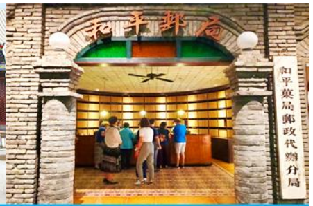
เมืองโบราณจำลอง