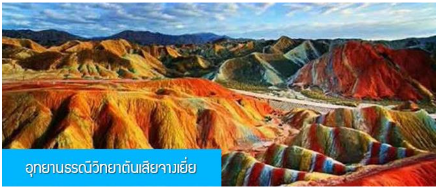
อุทยานธรณีวิทยาตันเสี่ยจางเยี่ย

พักที่ JIN WU INTER HOTEL โรงแรมระดับ 4 ดาวห้องดีน หรือเทียบเท่าในเมืองหวู่เว่ย