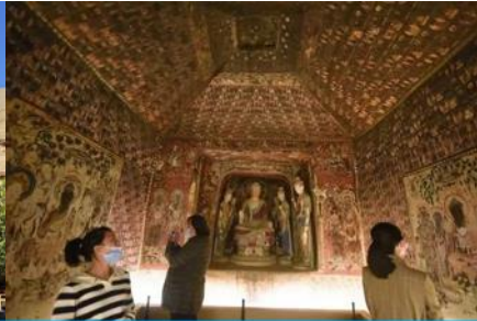
ชมภาพยนตร์ 3 มิติ