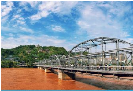
สะพานข้ามแม่น้ำฮวงโห