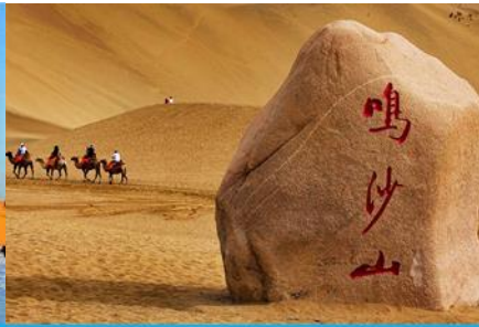
เนินทรายหมิงซาซาน