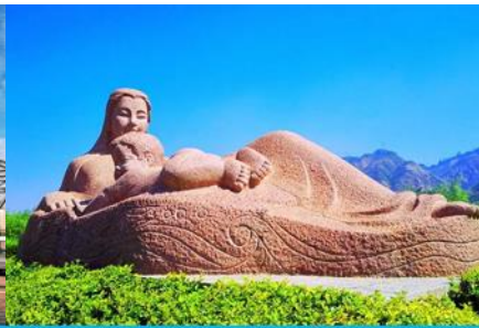
หินแกะสลักมารดาแม่น้ำฮวงโห