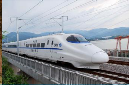
นั่งรถไฟความเร็วสูง