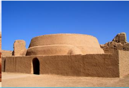
เมืองโบราณเกาซางกุ่เจิง