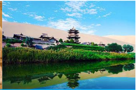
สระน้ำวพระจันทร