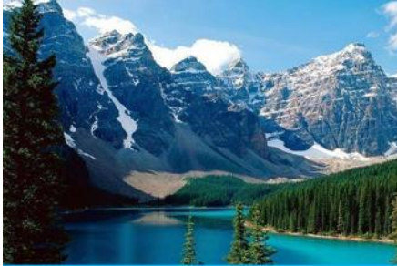
ภูเขาเทียนชาน

พักที่ HAMPTON BY HILTON URUMQI HOTEL โรงแรมระดับ 4 ดาวหรือเทียบเท่าในเมืองอูรูมฉี