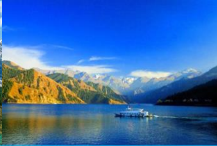
ล่องเรือทะเลสาบเทียนฉือ