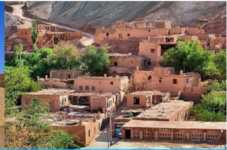
หมู่บ้านอูยгур์