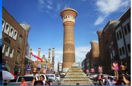
ตลาดต้าปาจา