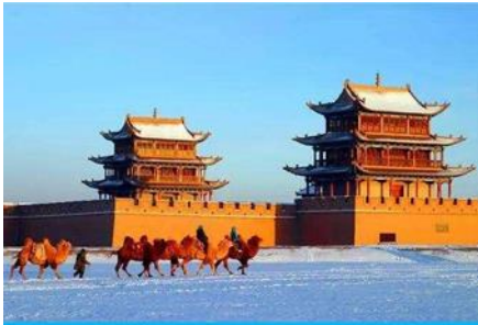
ด่านเจียยวี่กวน

พักที่ REZEN HOTEL ระดับ 4 ดาวท้องถิ่นหรือเทียบเท่าในเมือง เจียยวี่กวน