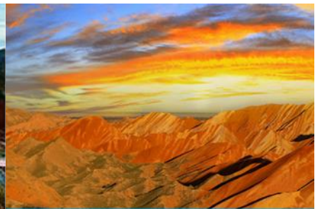
อุทยานภูเขาสายรุ้ง