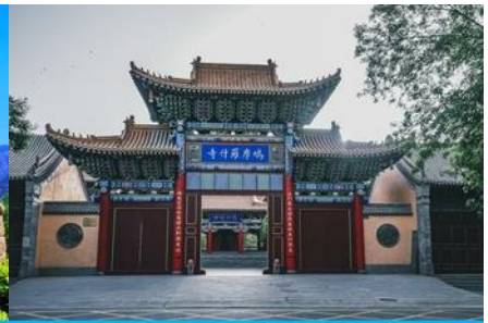
วัดจิวหม่วหลัวสื่อ