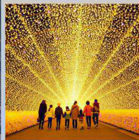
"NABANA NO SATO"