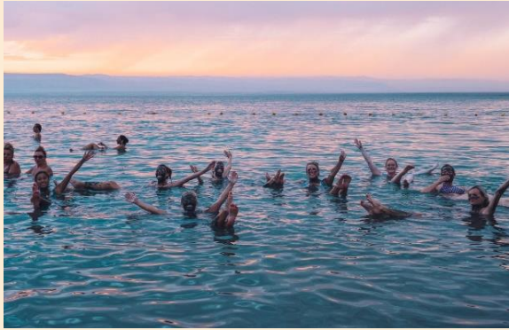
ท่านพักผ่อนตามอัธยาศัย

นำท่านเดินทางสู่ ทะเลสาบเดดซี (Dead Sea) (ใช้เวลาเดินทางประมาณ 45 นาที) หรือที่เรียกกันว่า ทะเลมรณะ อีกสมญานามหนึ่งว่าเป็น "ทะเลที่ไม่มีวันจมน" ตั้งอยู่ตรงเขตแดนประเทศจอร์แดนและอิสราเอล เป็นจุดที่ต่ำที่สุดในโลก มีความต่ำกว่าระดับน้ำทะเลถึง 400 เมตร และมีความเค็มที่สุดในโลกมากกว่า 20% ของน้ำทะเลทั่วไป ทำให้ไม่มีสิ่งมีชีวิตใดเลยอาศัยอยู่ได้ในท้องทะเลแห่งนี้ ความเข้มข้นของเกลือละลายอยู่สูงทำให้คนสามารถไปลอยน้ำในเดดซีได้ นำท่านเดินทางสู่โรงแรมที่พัก โรงแรมตั้งอยู่ริมทะเลสาบเดดซี ให้ท่านได้สนุกกับการพอกโคลน เพื่อบำรุงผิวพรรณ ให้นุ่มเนียน และเพลิดเพลินกับการลอยตัวในทะเลเดดซี เพื่อสุขภาพผิวพรรณที่ดี อิสระให้