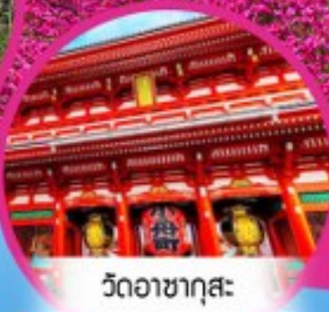
วัดอาซากุสะ