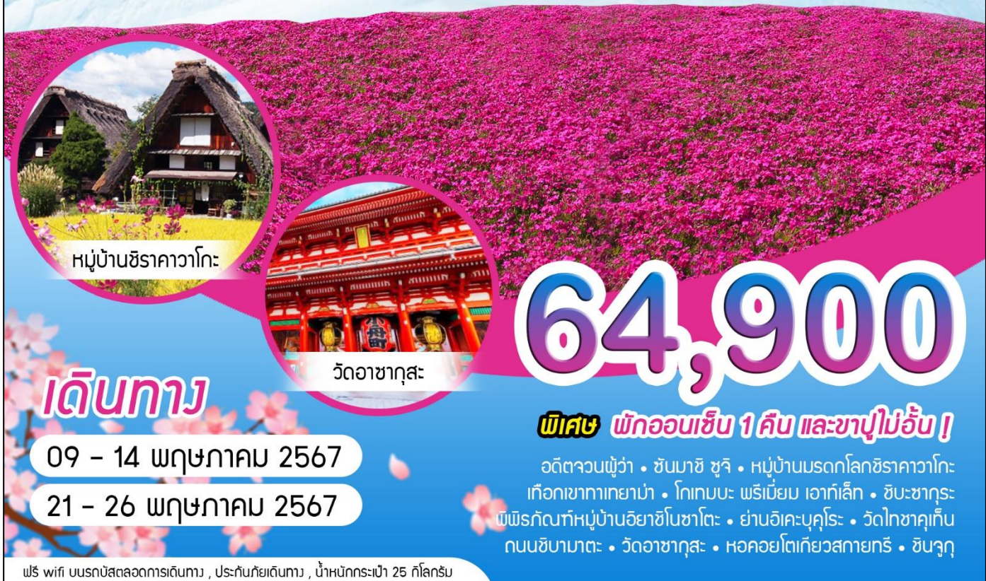
หมู่บ้านชิราคาวาโกะ

เที่ยวหุบเขาแอลป์ ชมซากุระ ซ้อปปีว์จุใจ | 6 วัน 3 คืน