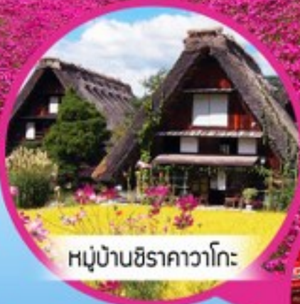
หมู่บ้านชิราคาวาโกะ

เที่ยวหุบเขาแอลป์ ชมซากุระ ซัปโปโรรุจิ | 6 วัน 3 คืน