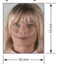
รูปถ่ายมาตรฐาน

*** สถานทูตไม่อนุญาตให้ดึงเล่มพาสปอร์ต หากได้ยื่นเข้าไปแล้ว ดังนั้นถ้าท่านรู้ว่าต้องใช้เล่มกรุณาแจ้งบริษัททัวร์ฯ เพื่อขอยื่นวีซ่าล่วงหน้าก่อนกรุป และให้แนบตัวเครื่องบินในช่วงที่ท่านจะเดินทางมาด้วย ***