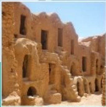
KSAR EL FARCH