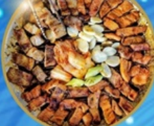
อาหารพรีเมียม ไม่จางร้านทั่ว