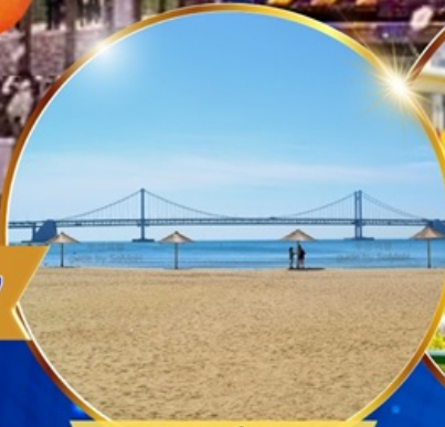
หาดแฮอินแด