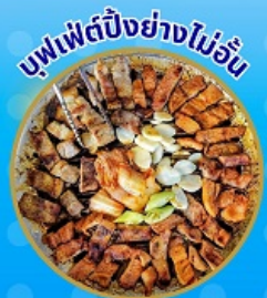
บุฟเฟ่ต์ปังอย่างไม่อื่น