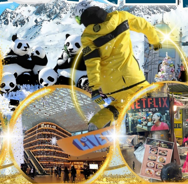
ห้องสมุด Starfield