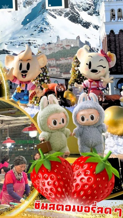
ตลาดกวางจง