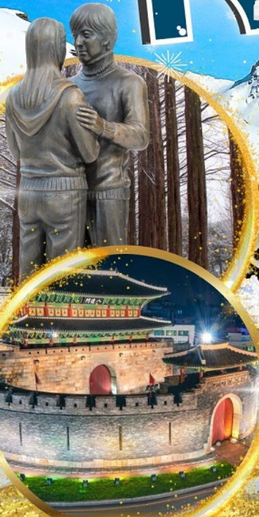
ป้อมฮวาซอง