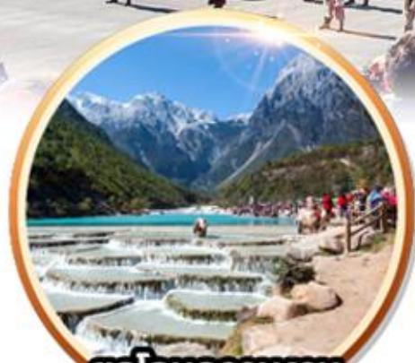
ยอดอมความงาม หุบเขาพระจันทร์สีน้ำเงิน