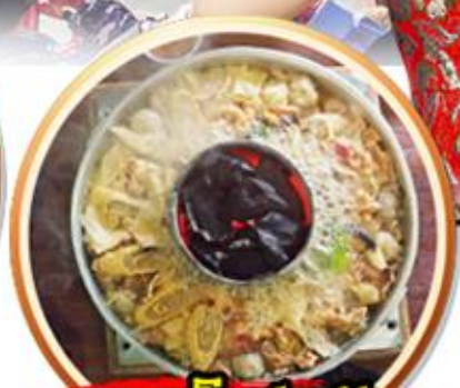
เมนูพิเศษ!! สุกี้เห็ดโตดำ+ปลาเซลมอน