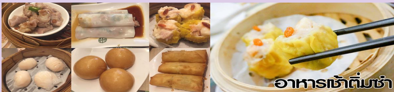
อาหารเช้าติ่มซำ

นำท่านไปไหว้ เจ้าแม่กวนอิมสงฮำ (Kun Im Temple Hung Hom) เป็นวัดเจ้าแม่กวนอิมที่มีชื่อเสียงแห่งหนึ่งในฮ่องกง ขอรเจ้าแม่กวนอิมพระโพธิสัตว์แห่งความเมตตา ช่วยคุ้มครองและปกป้องรักษาวัดเจ้าแม่กวนอิมที่ Hung Hom หรือ “Hung Hom Kwun Yum Temple” เป็นวัดเก่าแก่ของฮ่องกงสร้างตั้งแต่ปี ค.ศ. 1873 ถึงแม้จะเป็นวัดขนาดเล็กที่ไม่ได้สวยงามมากมาย แต่เป็นวัดเจ้าแม่กวนอิมที่ชาวฮ่องกงนับถือมาก แทบทุกวันจะมีคนมาบูชาขอพรกันแน่นวัด ถ้าใครที่ชอบเสียงเซียมซีเขาบอกว่าที่นี่แม่นมากที่สุดที่พิเศษกว่านั้น นอกจากสักการะขอพรแล้วยังมีพิธีขอของอั้งเปาจากเจ้าแม่กวนอิมอีกด้วย ซึ่งคนส่วนใหญ่จะนิยมไปในเทศกาลตรุษจีนเพราะเป็นสิริมงคลในเทศกาลปีใหม่ ซึ่งทางวัดจะจำหน่ายอุปกรณ์สำหรับเช่นไหว้พร้อมของแดงไว้ให้ผู้มาขอพร เมื่อสักการะขอพรโชดลากแล้วก็นำของแดงมาวนเหนือกระถางรูปหน้าองค์เจ้าแม่กวนอิมตามเข็มนาฬิกา 3 รอบ และเก็บของแดงนั้นไว้ซึ่งภายในของจะมีจำนวนเงินที่ทางวัดจะเขียนไว้มากน้อยแล้วแต่โชด ถ้าหากเราประสบความสำเร็จเมื่อมี