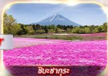
ชิบะซากุระ