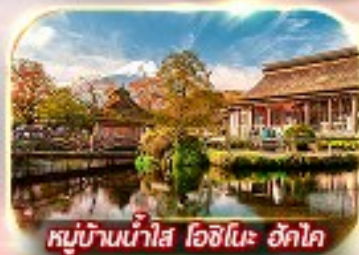
หมู่บ้านน้ำใส โอชิโนะ อักโก