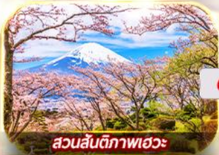
สวนสันติภาพเอวะ