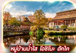
หมู่บ้านน้ำใส โอชิโนะ อักไก