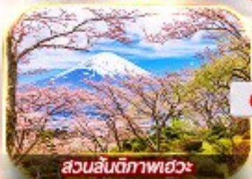
สวนสันติภาพเฮวะ