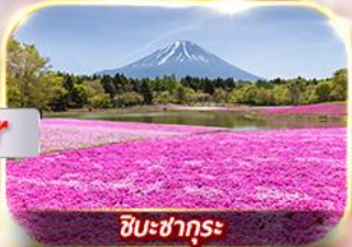
ชิบะซากุระ