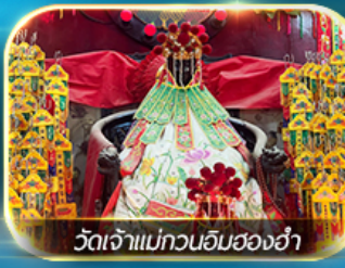
วัดเจ้าแม่ทวนอิมสองอ่า