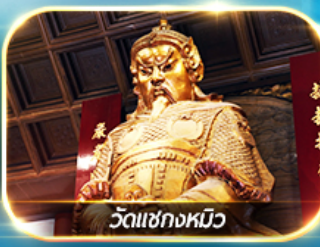
วัดเซ็กกหมิว