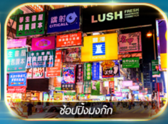
ช้อปปิ้งมอลล์

เต็มอิ่มทั้งบุญ และ ช้อปปิ้งแบบจัดเต็ม จิมซาจู้ย มงก๊ก