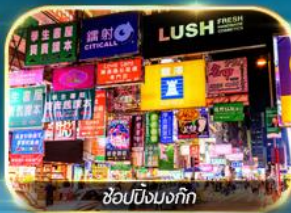
ช้อปปิ้งมงก๊ก

เต็มอิ่มทั้งบุญ และ ช้อปปิ้งแบบจัดเต็ม จิมซาจุ่ย มงก๊ก เกาะฮ่องกง ชมวิวอ่าววิคตอเรีย วัดเจ้าแม่กวนอิม เจ้าแม่กวนอิม หาดริฟลีส์เบย์ วัดหลินฟ้า โรงงานจิวเวอร์รี่