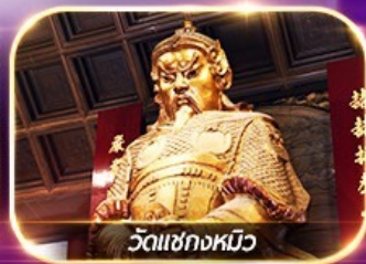
วัดเชกงหวี