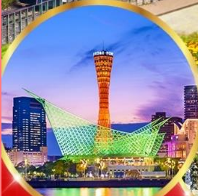
เมืองโกเบ