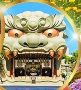
ศาลเจ้านิมมะ ยาชากะ