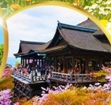
วัดคิโยมิจิ