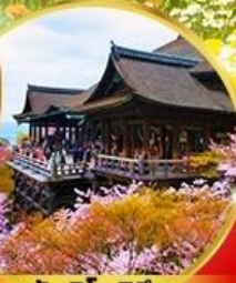
วัดคิโยมิจิ