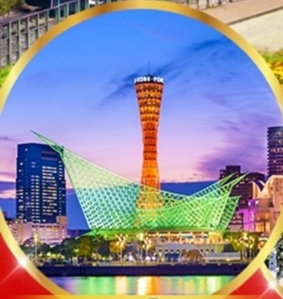
เมืองโกเบ

อิสระท่องเที่ยว 1 วันเต็ม วันอิสระเลือกชื่อ "Universal studio"