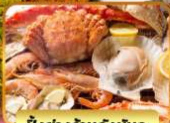
บิ๊งย่างร้านดังนั้นตะ