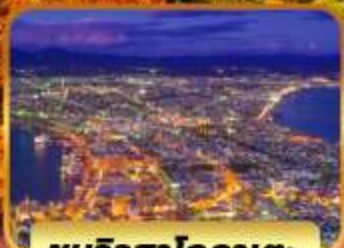
ชมวิวฮาโกดาเตะ