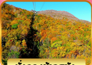
นั่งกระเช้าอุซุซัง