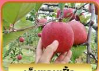
เก็บแอบเบิ้ล