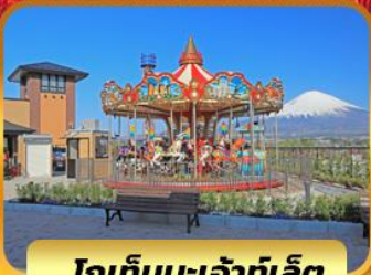
โกเท็มปะเจ้าที่เลิศ