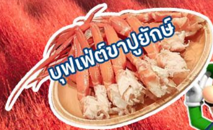
บุฟเฟ่ต์ชาปูยักษ์