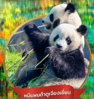
หมีแพนด้าเจียงเยี่ยน