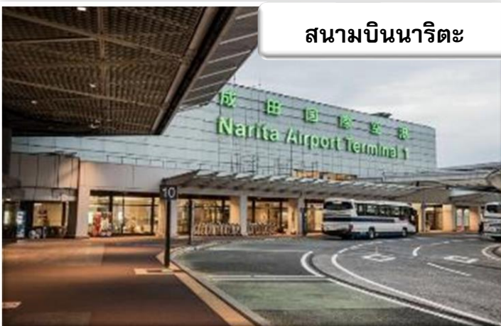
สนามบินนาริตะ