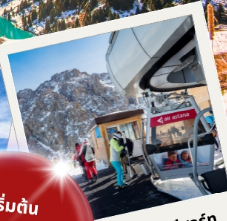
ซิมบูลิก สกี รีสอร์ท