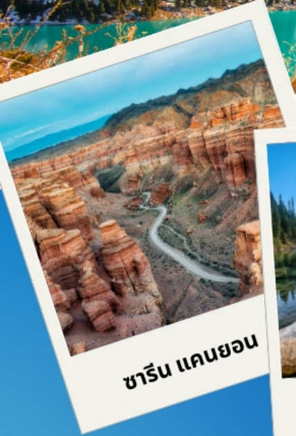
ซาริน แคนยอน