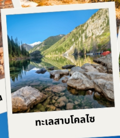
ทะเลสาบโคลไซ