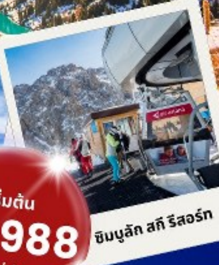
ซิมบูลิก สกี รีสอร์ท