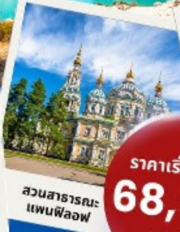
สวนสาธารณะ แพนฟีลอฟ