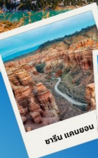
ซาริน แคนยอน