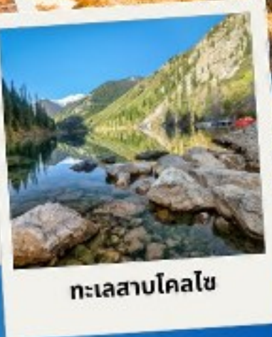
ทะเลสาบโคลไซ