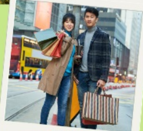
Free time Shopping