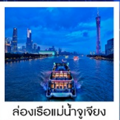
ล่องเรือแม่น้ำจูเจียง

ล่องเรือแม่น้ำจูเจียง / ช้อปปิ้งถนนปักกิ่ง / ช้อปปิ้งถนนซังซีจิว / วัดไทรหัดัน / ศาลเจ้าตระกูลเฉิน / ถนนคนเดินหย่งซังฟาง