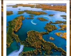
ทะเลสาบอูหลุนกู่

ผ่านทางด่วนทะเลทราย S21 / ทะเลสาบอูหลุนกู่ / ปู่อ๋อจิน / เซาโปซซา / ทุ่งหญ้าอาเหอถังโก่ตี้ / หมู่บ้านเหมอู่ซุน / คานาสีอ / ทะเลสาบมังกรหลับ / ทะเลสาบเทวดา จุดชมวิวกานาสีอ / ศาลาชมปลา / ค่องเรือทะเลสาบคานาสีอ / หาดห้าสี / เมืองปีศาจ / เมืองคาลามาอี / คาลามาอี / แกรนด์แคนยอนตูซันจือ / ตลาดต้าปาจา