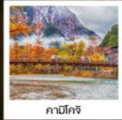
คามิโคจิ

ลิ้มรสเมนูสุดพิเศษ บุฟเฟ่ต์ซาซิมิอื่น ๆ / ซาบูระดับพรีเมียม