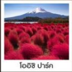
โออิชิ ปาร์ค