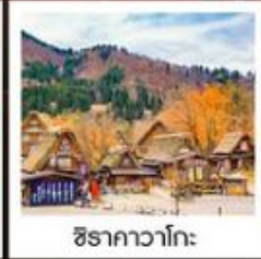
ชิราคาวาโกะ